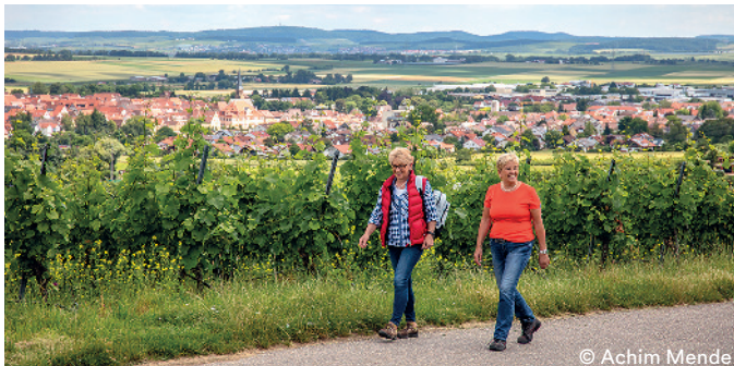
Wandern in den Weinbergen bei Bönnigheim