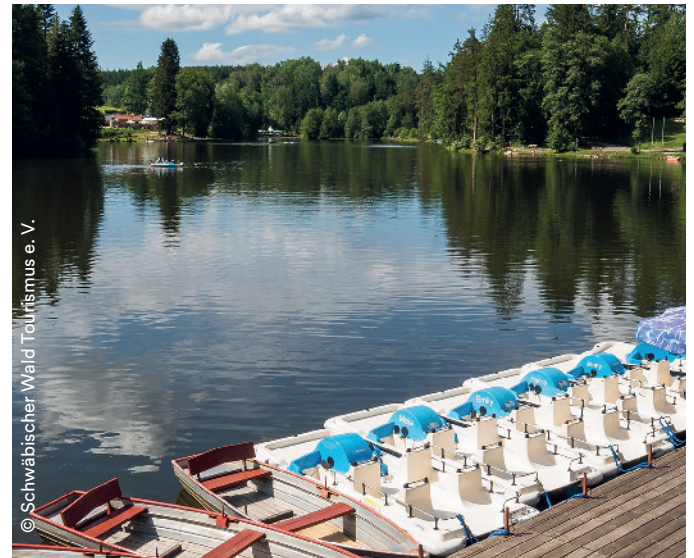
Ebensee, Perle im Schwäbischen Wald