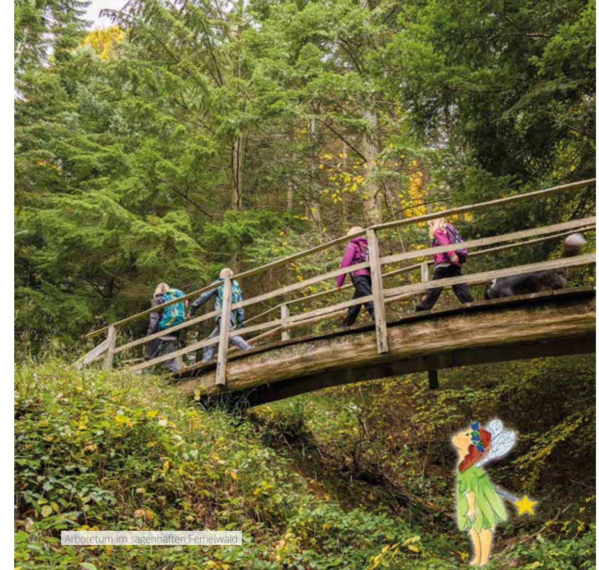
Arboretum im sagenhaften Femelwald

mit freundlicher Unterstützung durch Haller Löwenbräu