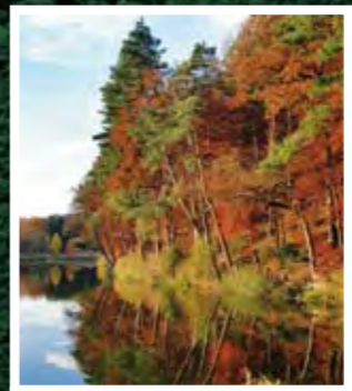
Der Finsterroter See in herbstlichen Farben.