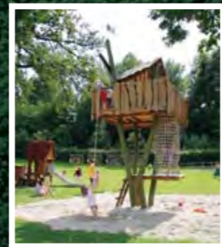
Der Abenteuerspielplatz direkt am See.