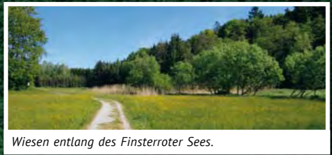
Wiesen entlang des Finsterroter Sees.

2008 wurde der Finsterroter See saniert. Direkt am See befinden sich eine Liegewiese, ein Barfußpfad und ein Kinderspielplatz. Für Aktive sind rund um den See Wanderwege und eine Nordic-Walking Strecke angelegt. Tret- und Ruderbootverleih ermöglichen eine schöne Fahrt auf dem Wasser. Für Essen und Trinken sorgt der Kiosk am See. Auch Angeln ist mit gültigem Jahresfischereischein und Tageskarte am Finsterroter See gestattet.