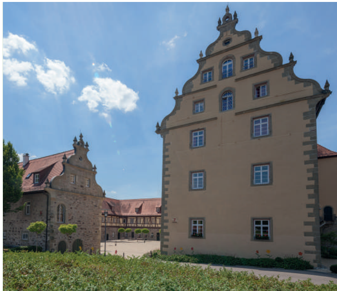
Schloss in Michelbach an der Bilz